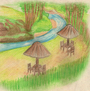
Cueva del mamut (parque Ecoturístico)